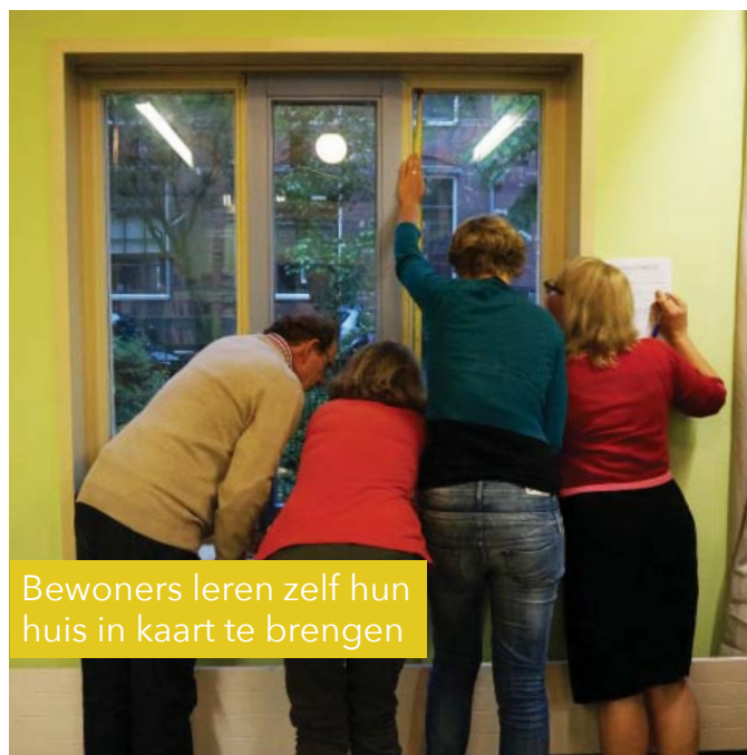
Bewoners leren zelf hun huis in kaart te brengen