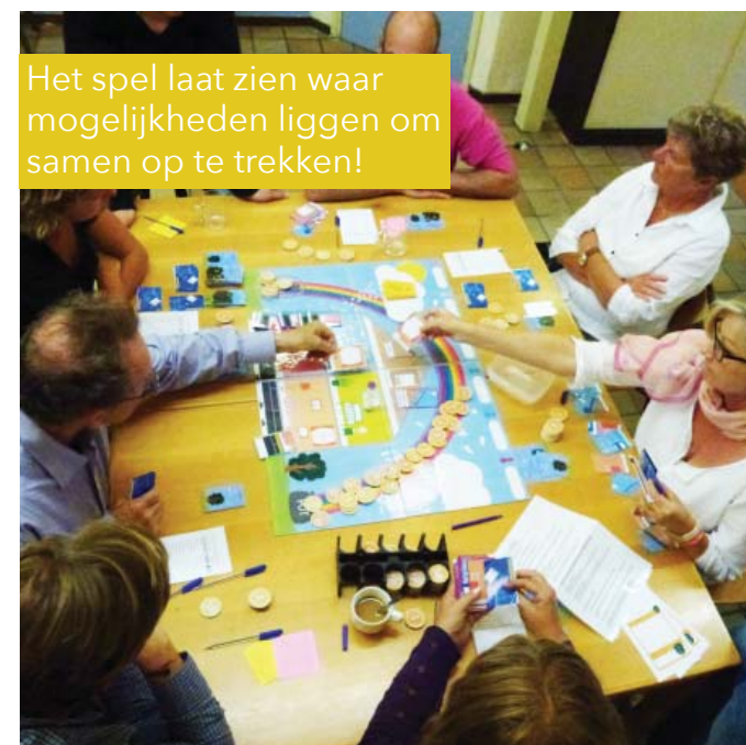
Het spel laat zien waar mogelijkheden liggen om samen op te trekken!