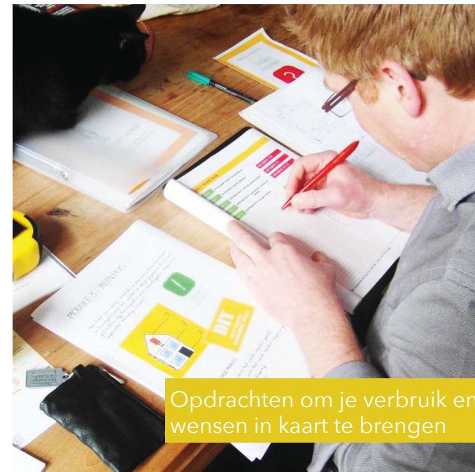
Opdrachten om je verbruik en wensen in kaart te brengen