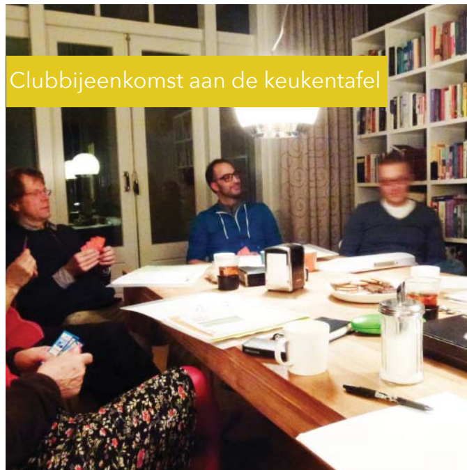
Clubbijeenkomst aan de keukentafel

Als eerste onderzoeken bewoners hun verbruik van gas, water en elektriciteit door middel van eenvoudige en leuke opdrachten en vergelijken dit met elkaar. Daarna gaan de deelnemers van de OWC hun woning en ambities in kaart brengen; waar zijn ze tevreden over, wat kan er beter en wat is de financiële ruimte die ze beschikbaar hebben?